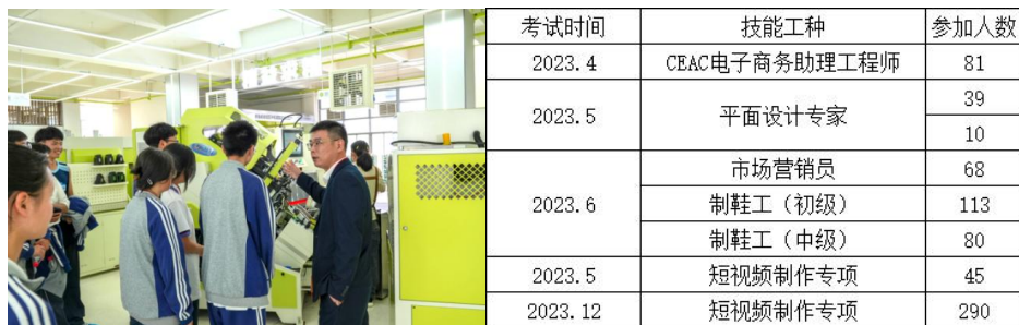
图 5-1 2024 年培训汇总

为使学生们了解鞋类传统生产和智能化生产的差别，4 月 23 日下午，产教融合中心协同班主任们带领 22 级鞋革工艺、皮具设计、鞋类设计专业的学生们参观温州康奈集团的智能车间。通过本次参观，学生们近距离感受了企业智能化生产和管理方式，激发了他们对未来的探索和创新意识，对他们未来的学习和职业规划有很大的帮助。同时，这也是学校与企业打造智能化平台的一次突破，为学校相关专业的建设和发展起到了积极的推进作用。