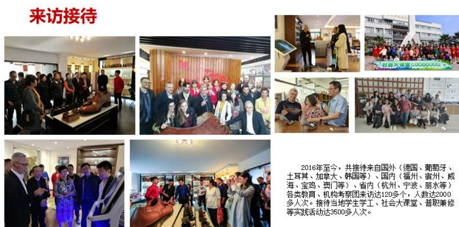
图 2-2 政企合作及国内外访学交流

菲律宾、印度尼西亚、德国、法国、美国、土耳其等国家。并依托校企结合模式，结合国家“一带一路”政策，寻求国际校际合作。同时以“两院”平台为载体，加大社会服务功能。推进社会培训，服务区域经济发展。以学校专业结构及特点出发，结合区域经济发展需求，对标产业发展前沿，为产业发展提供人才支持和科技服务，提升社会服务功能。2024 年度社会培训量达 2106 人，培训课程多样化，包括家庭教育指导、短视频、文化素养、鞋样设计等多个专业类别。