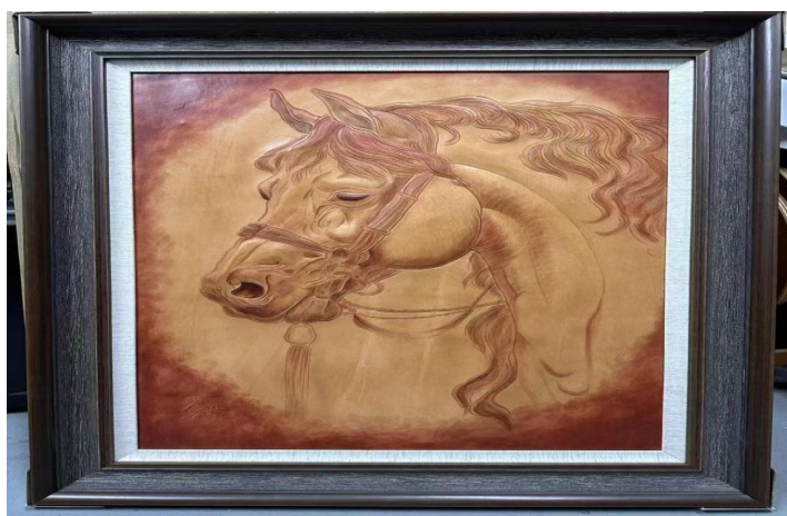
图 2-3 非遗项目