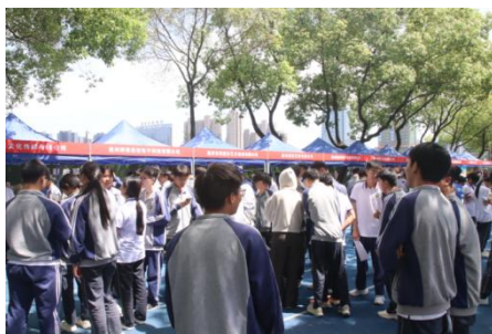
图 5-2 企业进入校园

产教融合作为职业教育发展的关键路径，对于培养适应市场需求的高素质技能型人才、推动地方经济发展具有不可替代的作用。2024年，鹿城区职业教育积极响应国家政策号召，以“鞋文化”特色育人模式为引领，强力推进产教融合、校企合作，不断增强社会服务功能，努力做强鞋类社会服务体系，为地方经济发展做出了积极贡献。温州市轻工职业学校致力于打造一批具备实际生产环境的教学基地，同时引进AI智能设计系统，为学生提供实践操作的机会，提高其职业技能和就业竞争力。这些实训基地不仅配备了先进的生产设备和技術，还模拟了企业的生产流程和管理模式，让学生在真实的工作环境中学习和实践。