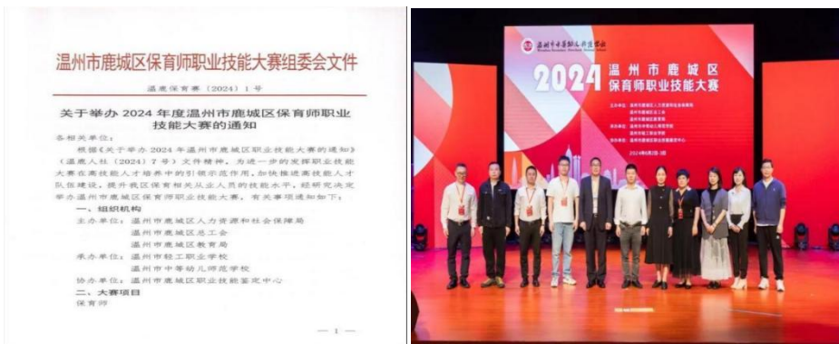
图 2-1 技能大赛