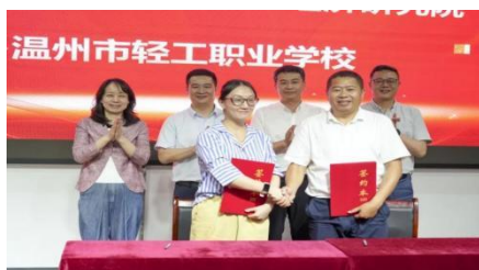
图 5-3 与北京服装学院温州美学经济研究院签约授牌

等方面进行了深入探讨，并在建立长期稳定的合作关系，实现资源帮扶，创新人才培养模式等方面达成共识。