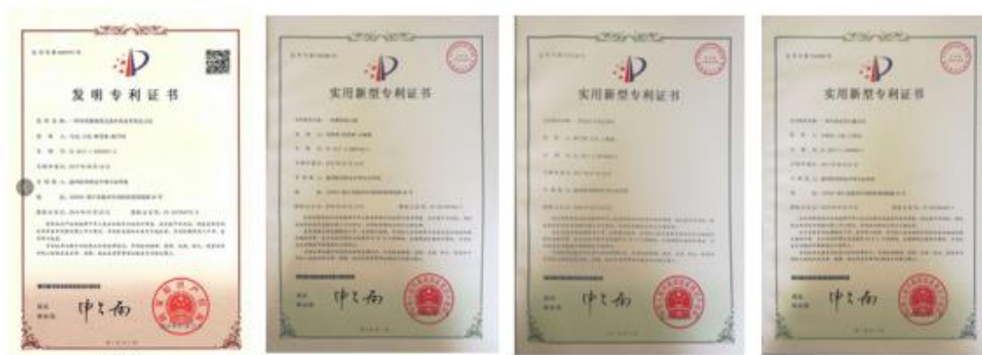
截止目前，学校师生成功申报国家发明、新型、外观专利（鞋类研究方向）共计278项。