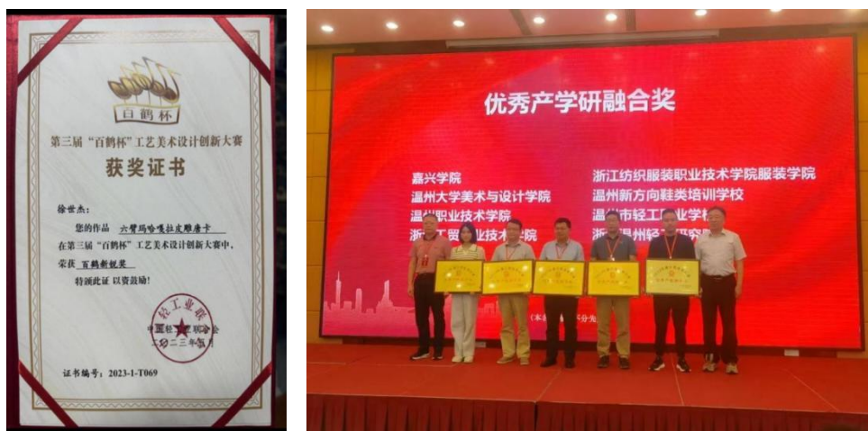
图 5-9 部分获奖证明

一等奖（指导师：杨乐、王一洲）；林满庭同学获得 2024 年温州市师生信息素养提升实践活动（微视频项目）一等奖（指导师：王晨虹）。