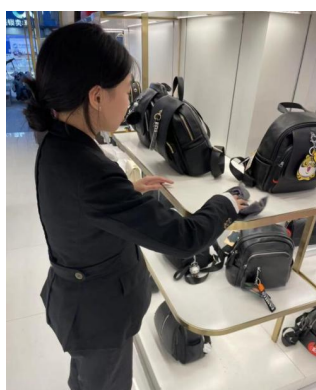
图 5-4 学生实习实拍