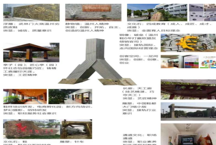
图 3-1 校园职业文化氛围