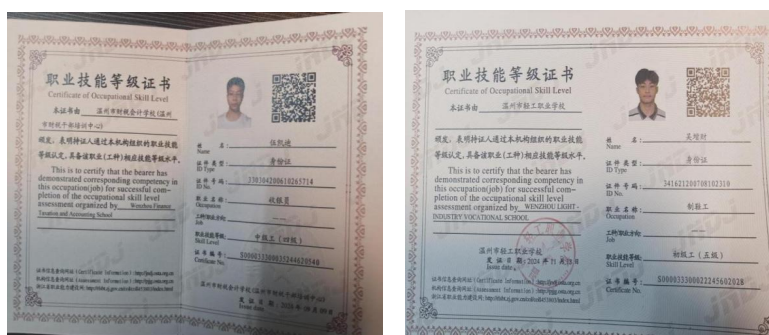
图 1-3 职业技能等级证书