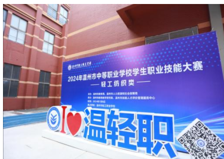
图 5-6 承办 2024 年温州市鹿城区制鞋工职业技能大赛

承办比赛，联合发展。 与温州市人社、鹿城区教育局、鹿城区工会、鹿城区职业技能鉴定中心等，承办了2024年温州市鹿城区保育师职业技能大赛，共计605人。大赛最终评选出6名获奖选手，同时有236人获得由温州市鹿城区职业技能鉴定中心颁发的保育师三级（高级工）职业技能等级证书。