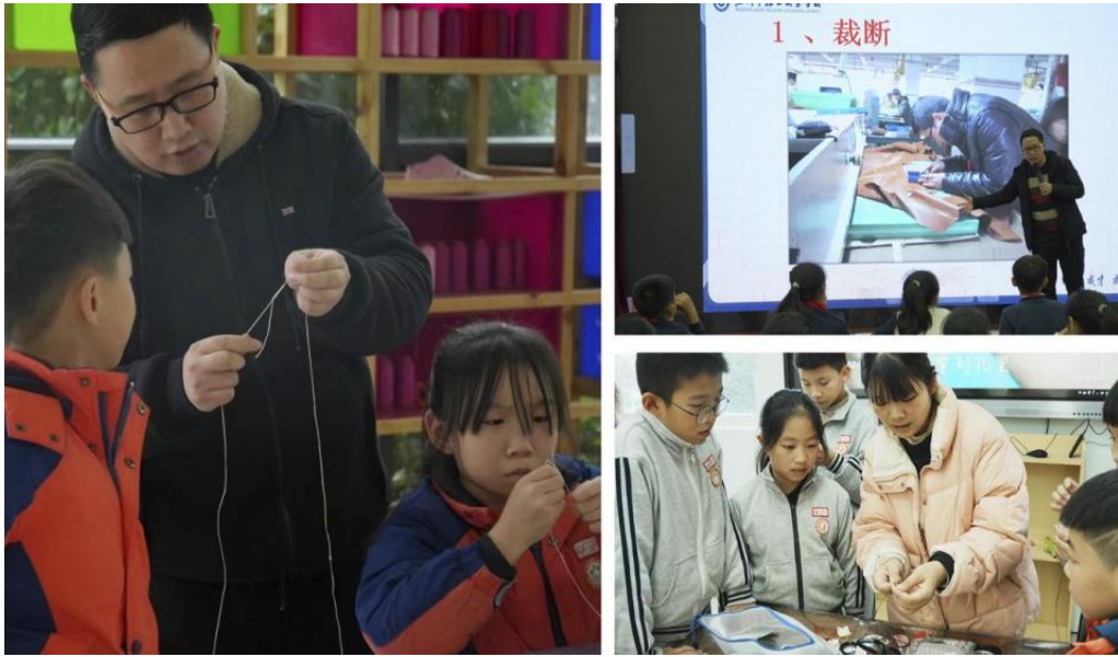
图 2-4 鞋类专业老师讲解鞋史