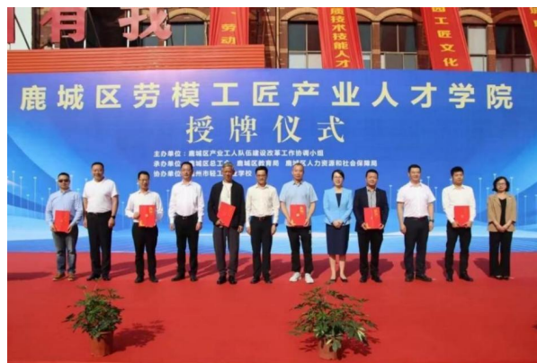
图 5-5 工会领导为鹿城区六位劳模工匠颁发劳模工匠学院导师聘书

硕果累累，深受喜爱。 2024 年继续开展面向社会的各类社会技能培训，培训量达 2106 人次。双证培训 215 人次。全年参加技能比赛 1720 人次。学校设温州市职业技能鉴定站，开展鞋类设计师 1-2 级、制鞋工 2-5 级的技能鉴定工作。学校与佰旺研发部温州佰旺贸易公司共同研发新款 330 款，其中靴子 52 款，单鞋 110 款，沙滩拖 15 款，凉鞋 40 款，男式休闲鞋 16 款，男式皮鞋 21 款，童鞋 76 款。新款开发深受客户喜爱，共产生订单新款 103 款，中单率 31.2%。借助新产品开发优势，大力拓展国际市场，包括菲律宾、印度尼西亚、德国、法国、美国、土耳其等国家。